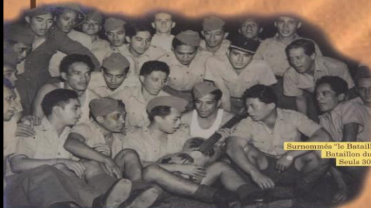
Surnommés « le Bataillon des guitaristes », les 600 volontaires du Bataillon du Pacifique ont mené de rudes batailles. Seuls 300 d'entre eux ont survécu.