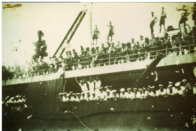
Port de Papeete – 21 avril 1941

Dès l'annonce de l'armistice signé par le Maréchal Pétain et dès l'Appel du 18 juin 1940, les Polynésiens ont manifesté avec force et détermination leur volonté d'aller se battre pour aider la France à se relever.