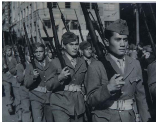
Défilé du Bataillon du Pacifique

Il participe à la contre-offensive alliée à travers la Libye et la Tunisie en 1943.